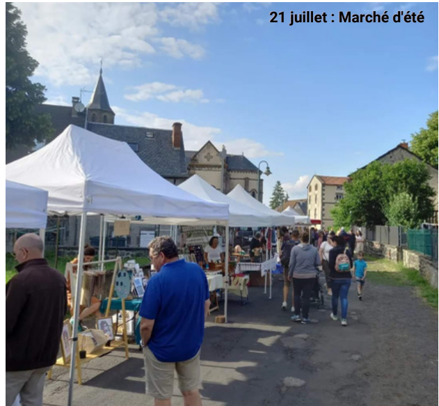
21 juillet : Marché d'été