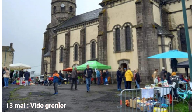
13 mai : Vide grenier