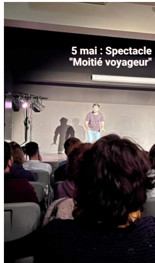
5 mai : Spectacle "Moitié voyageur"