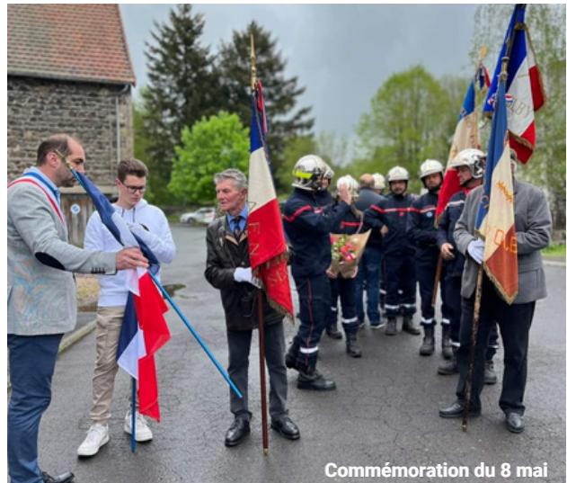
Commémoration du 8 mai