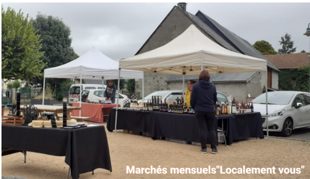
Marchés mensuels "Localement vous"